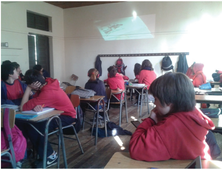
Imagen 4. Últimas sesiones durante la exhibición de los nanometrajes

Esta actividad de poner en común los trabajos para la retroalimentación de profesores y estudiantes es parte del cotidiano de las prácticas pedagógicas en este establecimiento, no solo en Artes Visuales. En estas situaciones pudimos observar el despliegue de las experiencias adolescentes para dar y recibir críticas a modo de retroalimentación de los trabajos realizados.