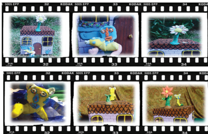
Figura 2. Storyboard del Nanometraje Flor de Vida

Las creadoras de Flor de vida señalaron en la entrevista que se trata de “una metáfora. Era una flor que al pasar el tiempo se le iban cayendo los pétalos y cada pétalo iba representando como una etapa o un ciclo de la vida”. El contexto de este nanometraje es un espacio mágico y fantástico. Los personajes son seres sin definición humana ni animal. El uso del stop motion , como técnica de producción para dar movimiento a las figuras de plastilina, fue motivación y decisión de las estudiantes. Es interesante, pues tanto la música melódica que acompaña el nanometraje, como la técnica del stop motion , hacen guiños al cine de animación difundido en producciones de Pixar por ejemplo.