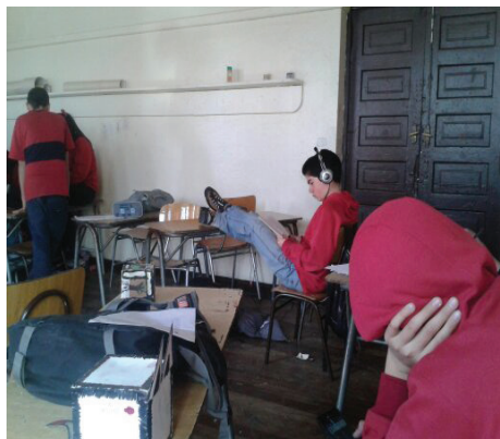
Imagen 2. 8° en clase de Artes Visuales